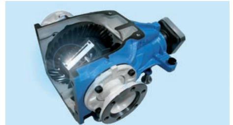
Drahtlos abgefragte Temperatursensoren im Differenzial

Eingeklemmte Späne führen dazu, dass die Werkzeuge nicht »rund laufen« und somit die gewünschte Fertigungsqualität nicht erreicht werden kann. Bereits kleinste Verunreinigungen, bzw. mikrometerdicke Späne, führen zu nicht tolerierbaren Rundlauf Fehlern der Werkzeuge – eine Ausschussproduktion ist die Folge. Das von promicron entwickelte und gefertigte SiS-Überwachungssystem ist in entsprechend modifizierte Motorspindeln integriert, mikro-mechanisch aufgebaut und widersteht selbst härtesten Einsatzbedingungen bei Spindeldrehzahlen bis zu 18.000 U/min. Das beweisen derzeit die drei bereits im Einsatz befindlichen Systeme beim Endanwender in Großserienfertigung. Das System wird induktiv mit Energie versorgt, übermittelt die Daten drahtlos vom Rotor der Spindel und arbeitet zudem völlig wartungsfrei.