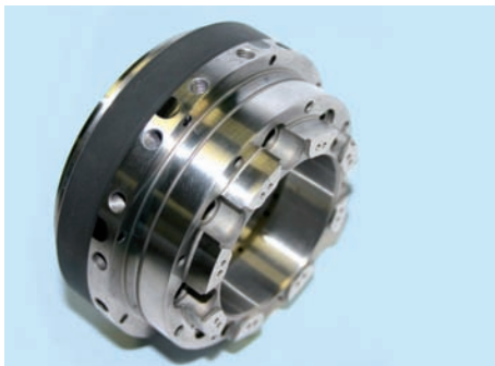
Spindeladapter mit integrierter drahtloser Sensorik zur »Span-in-Spindel-Überwachung«

promicron hat ein Überwachungssystem für Werkzeugmaschinen entwickelt, welches eingeklemmte Späne zwischen Werkzeug und Motorspindel beim automatischen Werkzeugwechsel erkennt. Das »Span-in-Spindel-Überwachungssystem« (kurz: SiS) meldet innerhalb von wenigen Millisekunden nach dem Werkzeugwechsel der Maschinen-